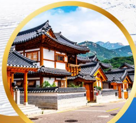
หมู่บ้านโบราณฮินยอง