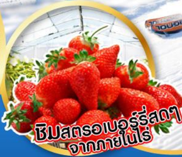
ชิมสตรอเบอร์รี่สดๆ จากภายในไร่